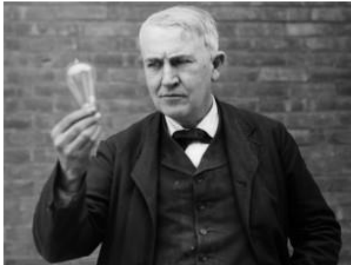
Zitat vor 100 Jahren von: Thomas A. Edison

Ich hoffe, wir müssen nicht erst die Erschöpfung von Erdöl und Kohle abwarten, bevor wir das angehen.“