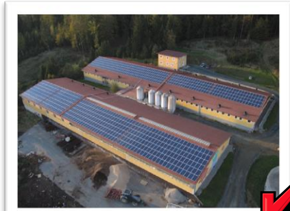
200 KWp in Steiermark